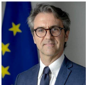
Ông Giorgio Aliberti Đại sứ EU tại Việt Nam